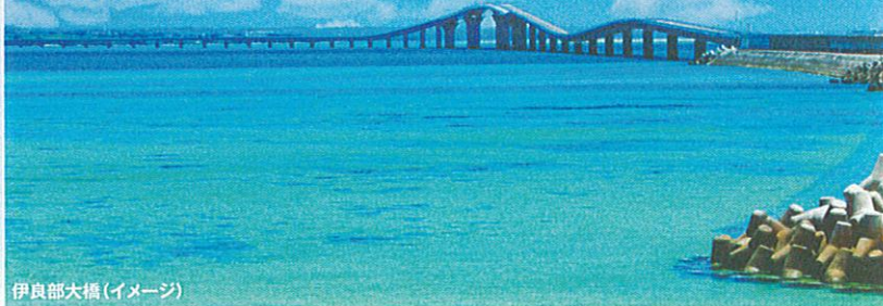
伊良部大橋(イメージ)