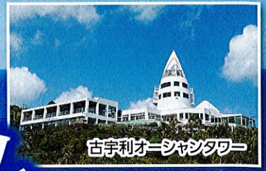
古宇利オーシャンタワー